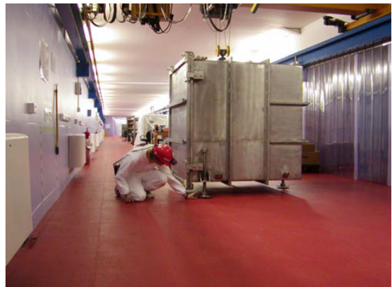
Figur 2. Vakuum-kammeret til mørkt stof-detektoren under installation i Boulby-laboratoriet.

fra fjerne galakser er langt større, end den skulle være, hvis der kun var det normale, synlige stof i nærheden til at afbøje lyset. Nylige observationer af en gigantisk kollision mellem to galaksehobe (figur 1), viser således muligvis en separation af det normale og det mørke stof i galakserne. I kollisionen vekselvirker partikler af normalt stof med hinanden, og det bremser partiklerne, mens partikler af mørkt stof ikke vekselvirker på samme vis og derfor ikke bremses op.