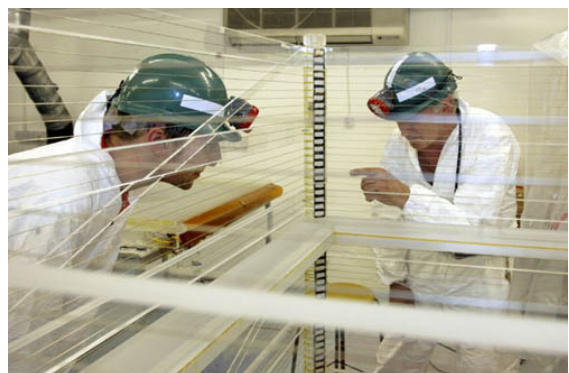
Figur 3. De indre dele af detektoren inspiceres.

Spørgsmålet er imidlertid, hvilke partikler, som udgør det mørke stof. Fra forskellige udvidelser af partikelfysikkens standardmodel er der kommet en række forslag til mørke partikler, bl.a. "axioner", "sterile" neutrinoer og "WIMP"s – Weakly Interacting (svagt vekselvirkende) Massive Particles. Den sidste gruppe har været i fokus for flere eksperimentelle forsøg på at detektere mørkt stof og WIMP'erne omfatter flere