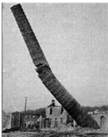
Figur 1. Faldende skorsten (billede fra “Physics in the Toy Room: Toppling Towers”, www.physicscentral.com).

Hvor knækker en væltende murstensskorsten i faldet? Begrund svaret.