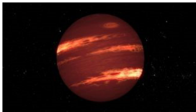
Figur 1. Grafik af en brun dværg med flere farvede bånd af skyer (NASA/JPL-Caltech). Se animation på https://youtu.be/tbyjrFdoXLk .

Ref.: https://www.space.com/ og arXiv:2209.00620 .